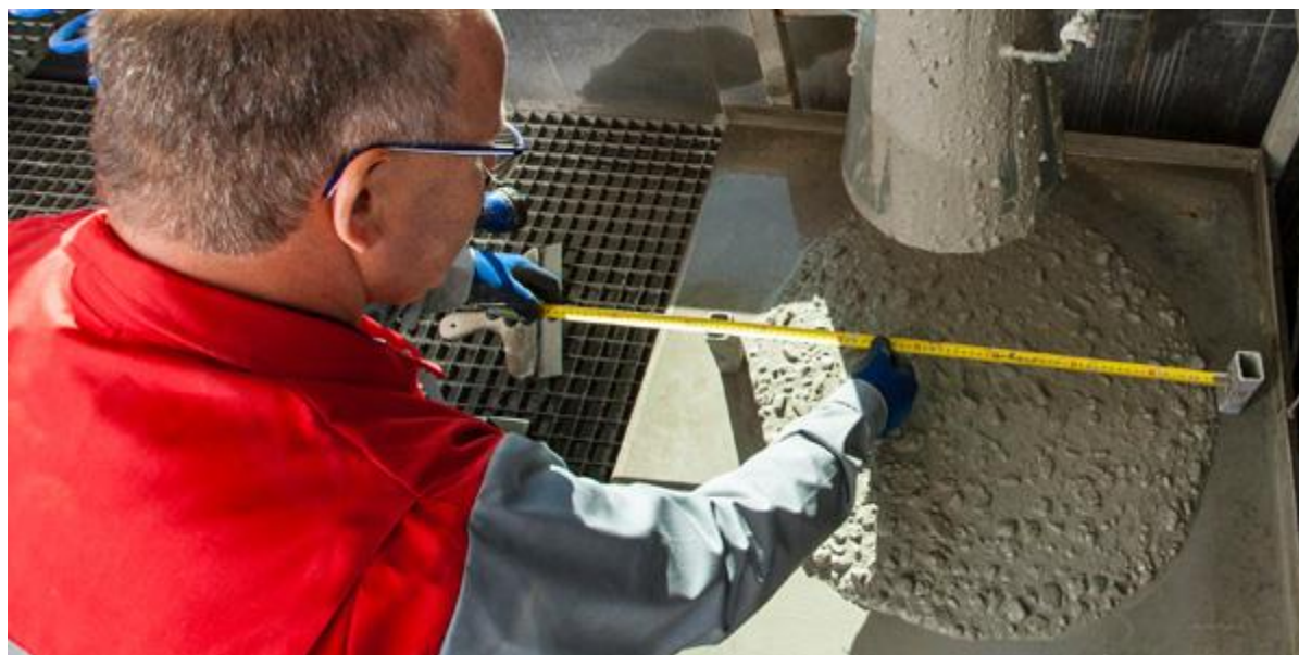
De laborant voert kwaliteitscontroles uit, zoals testen van de hardheid van het eindproduct.