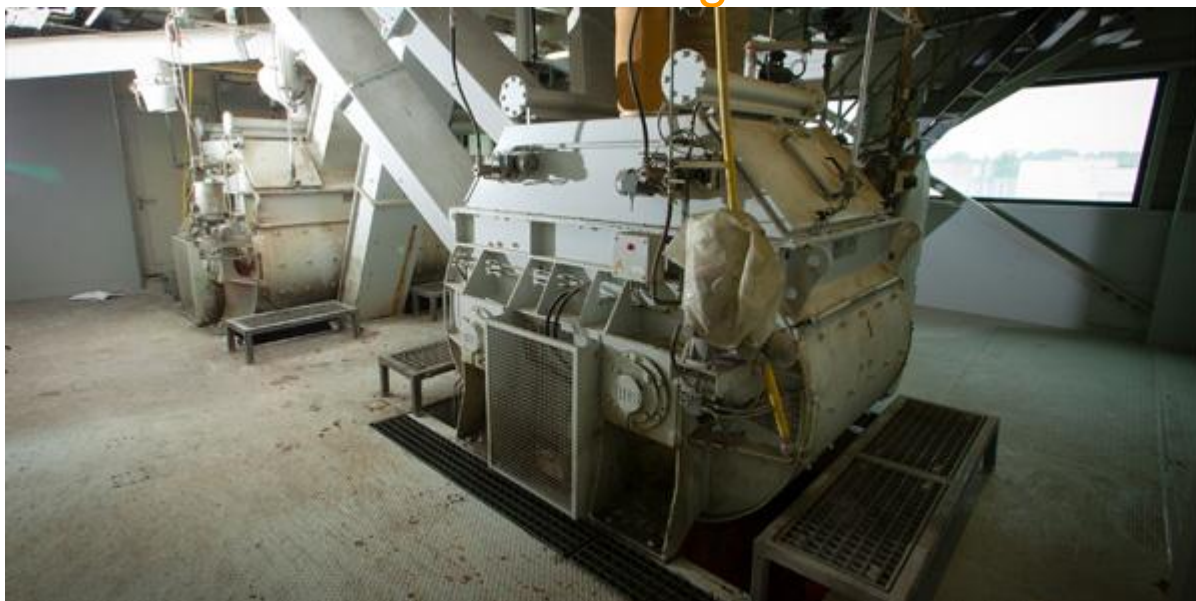
Een menger wordt elektrisch aangedreven en mengt grondstoffen tot betonmortel.