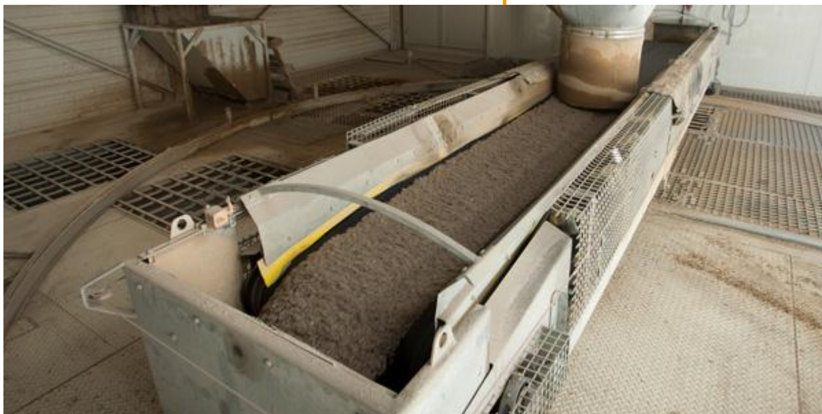
Vanuit de bedieningsruimte wordt de transportband bestuurd.