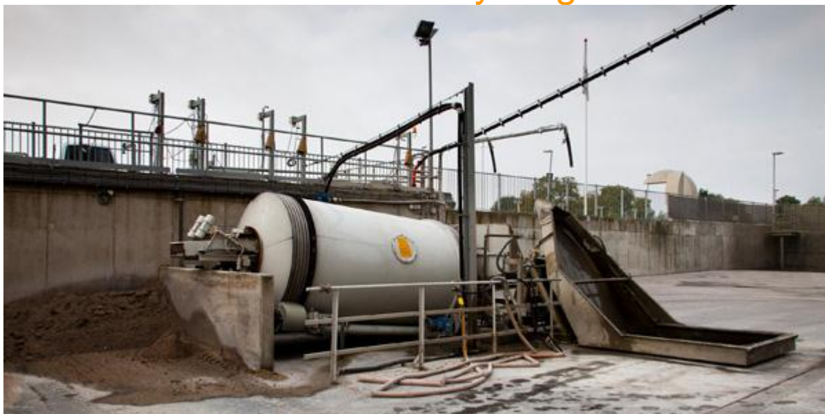
Een recyclinginstallatie wordt gebruikt voor het terugwinnen van de grondstoffen uit het speelwater en restbeton.