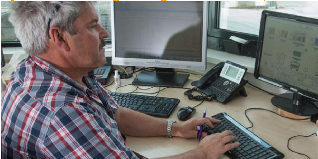
Voor de mengmeester is beeldschermwerk de zwaarste fysieke belasting.