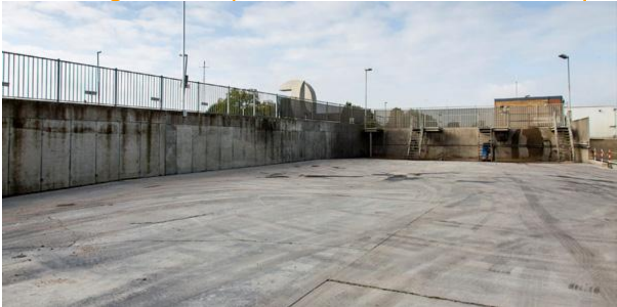
Een opgeruimd terrein is een voorbeeld van Good house keeping.

Slordigheid en gebrek aan properheid leiden makkelijk tot ongevallen. Struikel- en valgevaar bij rondslingerend materieel, risico op uitglijden over water- of betonresten zijn enkele voorbeelden.